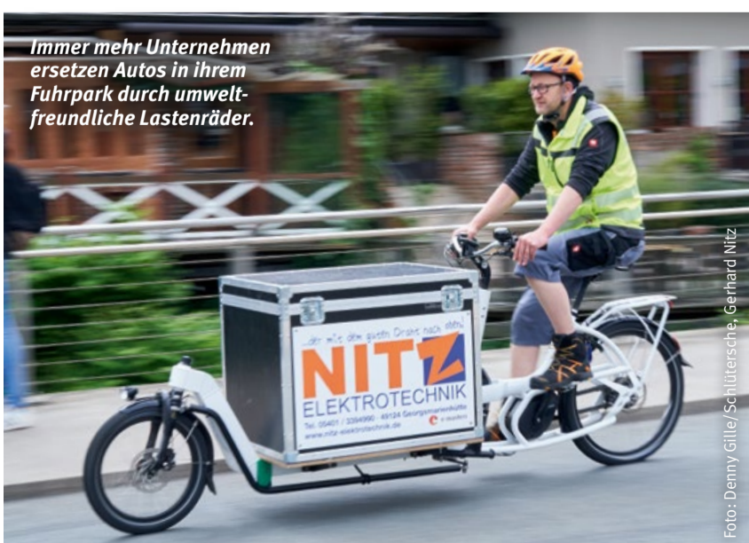
Immer mehr Unternehmen ersetzen Autos in ihrem Fuhrpark durch umweltfreundliche Lastenräder.