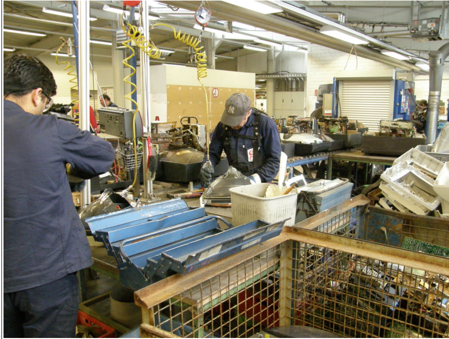
Abb.1: Demontagearbeitsplätze

Bei den Demontagearbeiten an den Geräten ist somit eine Gefahrstoffaufnahme über die Atemwege, die Haut und den Mund möglich (dermale, inhalative und orale Aufnahme). Bei den Demontagearbeiten kann eine Vielzahl verschiedener Gefahrstoffe freigesetzt werden. Vorkommen und Gefährdungspotenzial ausgewählter Stoffe sind nachfolgend beschrieben.