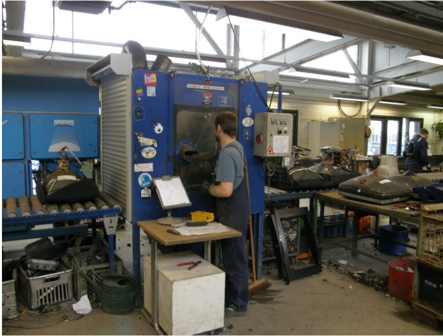
Abb.2: Reinigungsarbeiten in der Reinigungskabine